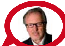
Jochen Rausch Wellenchef des WDR- Jugendsenders 1LIVE