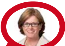
Ute Schäfer Jugendministerin des Landes Nordrhein-Westfalen

Jugenddialog 2020 ist ein gemeinsames Projekt der Stiftung Mercator und der Katholischen Akademie DIE WOLFSBURG sowie und der Landeszentrale für politische Bildung Nordrhein-Westfalen und steht unter der Schirmherrschaft von NRW-Ministerpräsidentin Hannelore Kraft. Die Teilnehmer bearbeiten in kulturell, religiös und sozial heterogen zusammengesetzten Gruppen über mehrere Monate hinweg ein selbst gewähltes Thema zu zentralen Zukunftsfragen unserer Gesellschaft. Bei der Präsentation vor Politikern, Wissenschaftlern, Entscheidungsträgern und anderen Personen des öffentlichen Lebens werden die Ergebnisse und Thesen der Dialoggruppen diskutiert. Dem Dialog mit Jugendlichen zu Zukunftsfragen des gesellschaftlichen Zusammenlebens stellen sich: